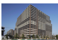
2010年2月竣工(777戸) フォレシアム