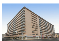
1973年7月竣工(250戸) シャリマンコーポ野江I