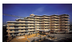
1990年2月竣工(57戸) シャリエ岸和田