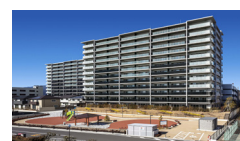
EAST 2017年3月竣工(95戸) WEST 2018年3月竣工(95戸) シャリエ長泉グランマークス