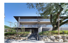
2020年8月竣工(44戸) シャリエ京都山科